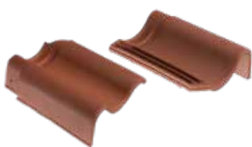
gevelpan links en rechts