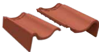
gevelpan links en rechts