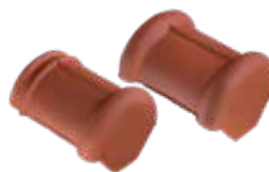
halfronde beginvorst en eindvorst