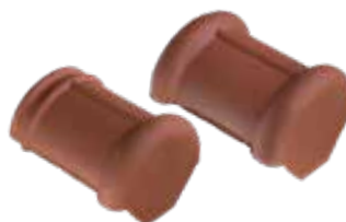
halfronde beginvorst en eindvorst*