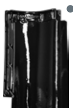
gitzwart glanzend verglaasd