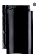
zwart mat verglaasd