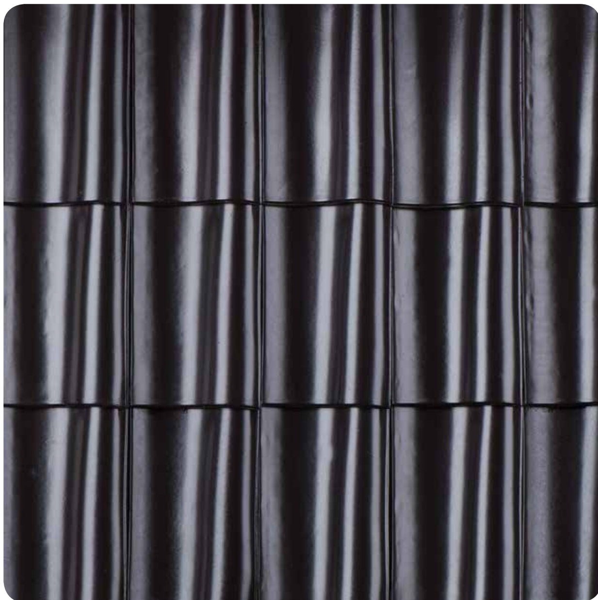
zwart vol donker engobe ●

De Nieuwe Hollander-V is leverbaar in vijf bijzondere afwerkingen en in zeven kleuren voor een uitstraling die net even anders, net even exclusiever is.