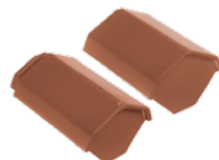
HV begin- / eindvorst type K