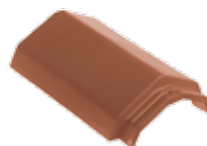
HV vorst type K