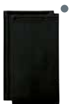
zwart vol donker engobe