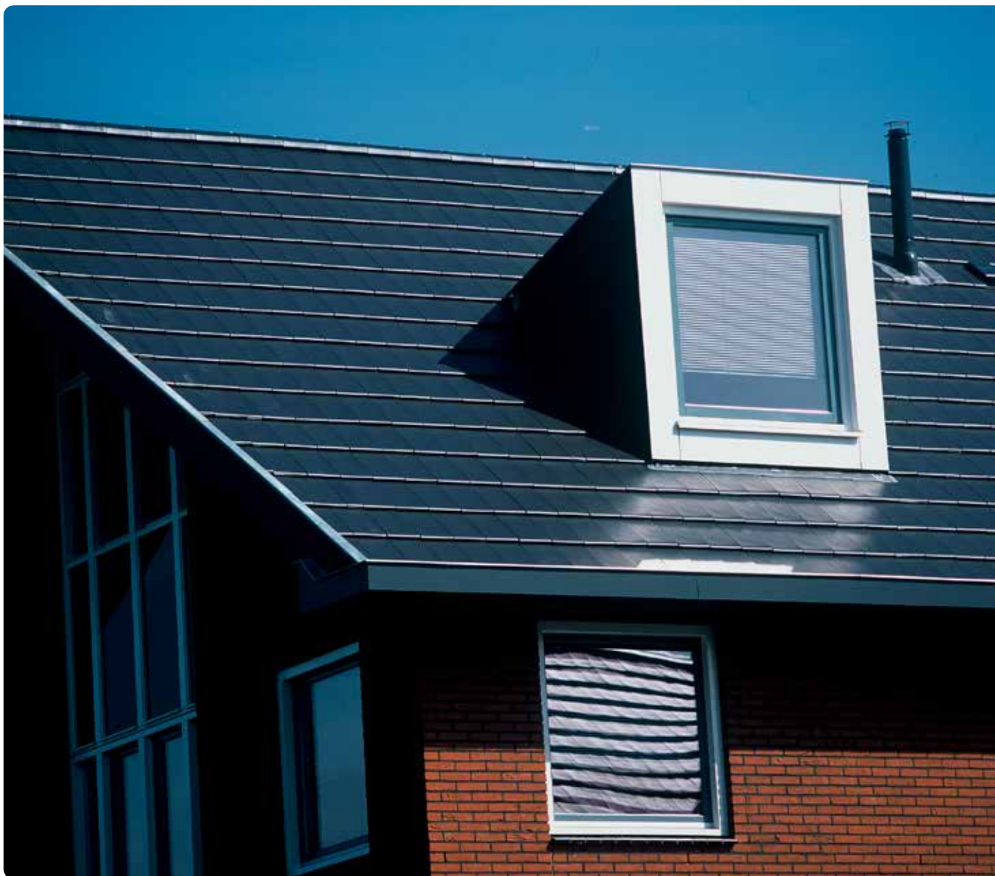
Zwart vol donker engobe